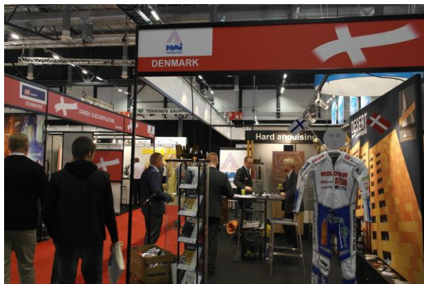
Den danske fællesstand 2015

Under messen vil ambassadøren besøge den danske fællesstand.. Du er velkommen til at foreslå gæster hertil. Ved ønske om ambassadens assistance til yderligere research og salgsfremmende aktiviteter, kan dette tilkøbes.