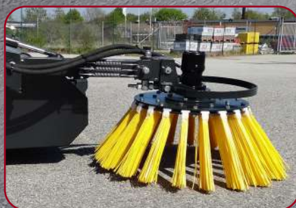
Sidoborste med mekanisk uppfällning och tre olika inställningsmöjligheter