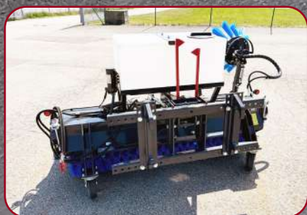
Sopvals SV-200 Proffs L med multifäste och redskapskrokar