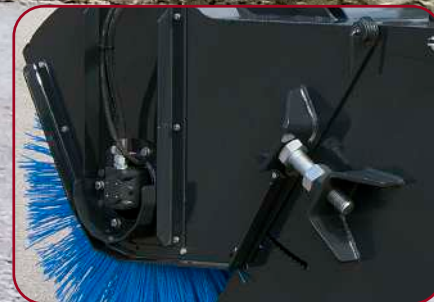
Borstrotorn justeras enkelt med en stor bult med kontramutter