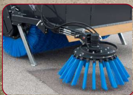
Sidoborsten går att använda även med uppfälld box