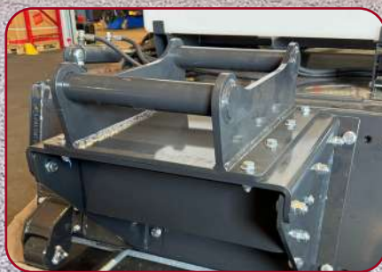
Sopskopa med grävmaskinsfäste monterat S40 / S45 / S60