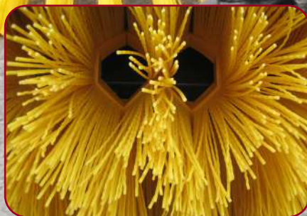
ZigZack borst med sexkantsutförning