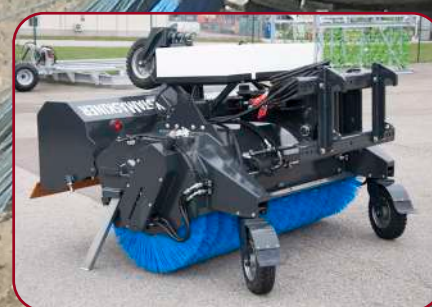
Stabila runtomsvängande massiva stödhjul och uppfälld uppsamlingsbox