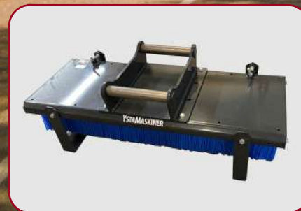
Flera bultade varianter av grindfästen