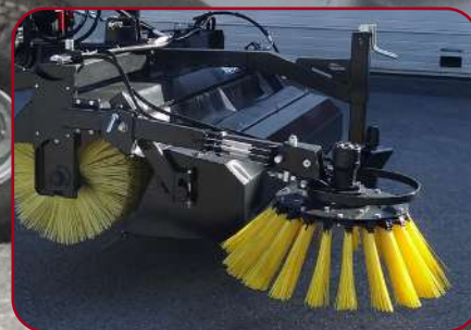
Sidoborste med mekanisk uppfällning och tre olika inställningsmöjligheter