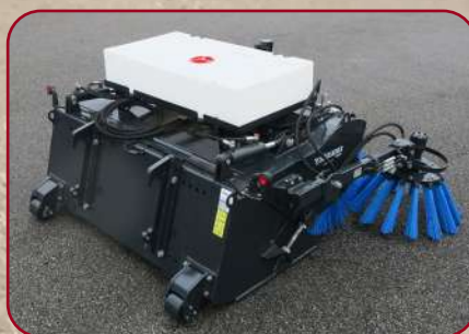
SS-155 med stödrullar och positionsljus