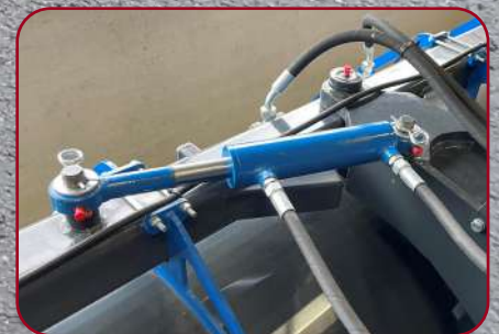
Hydraulisk justering av borstvinkel (standard), styrs via elektrisk 6/2-ventil