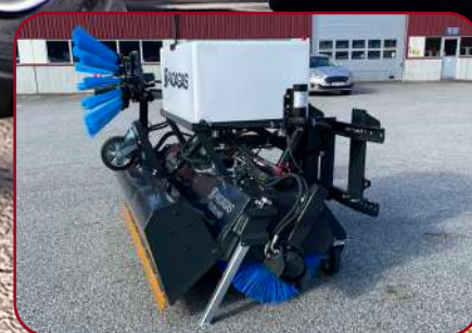
Sopvals SVF HB med öppen uppsamlare/box