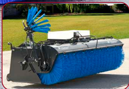
Sopskopa SS-300 med monterad sidoborste och vattensystem