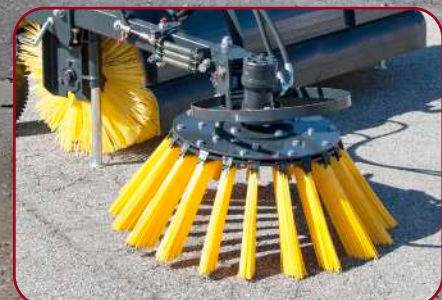
Sidoborste diameter 700 mm (Tillval)