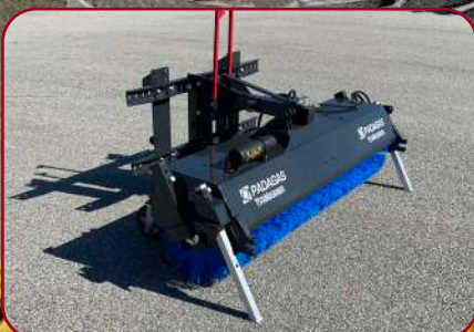
Sopvals SVF-180 med multifäste