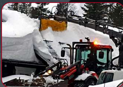
SV-150G för snöröjning av tak