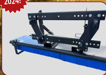
YB-300 med kombifäste för lastare och truck