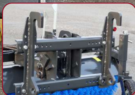
Multifäste med flytläge & indikationsflaggor