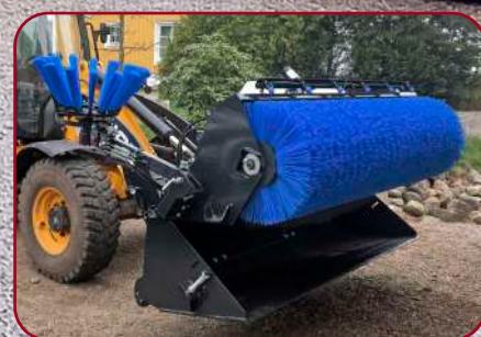
Sopskopian töms genom att lyfta upp borstrotorn och sen tippa skopan