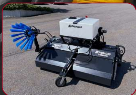
Sopvals SV-200HB Proffs L med monterad sidoborste och vattensystem