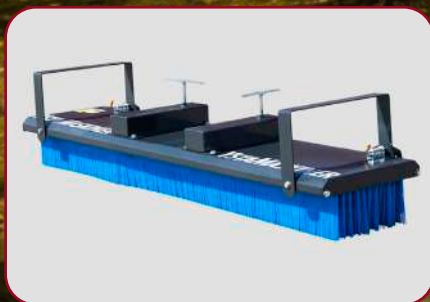
Sopborste YB-245 med gaffelfäste och uppfällda stödben