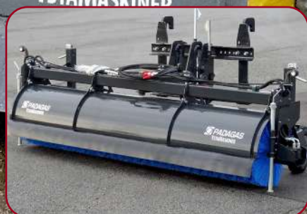
Sopvals SV-290 med Stora BM fäste