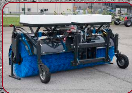
Sopvals SV-300 med luftfyllda stödhjul och flytläge med indikationsflaggor