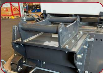
Sopskopa med grävmaskinsfäste monterat S40 / S45 / S60