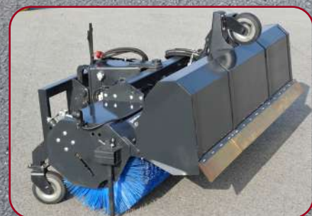
Finns även med uppsamlingsbox som även kan köras uppfäld