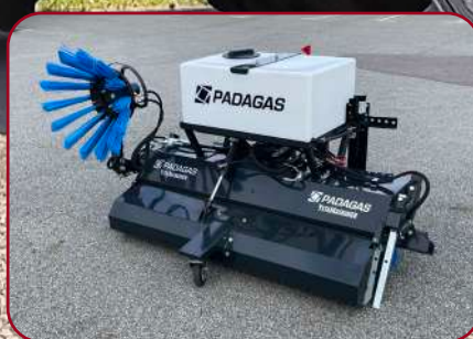
Sopvals SVF-180HB med monterad sidoborste och vattensystem