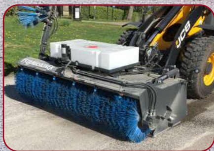
Sopskopa SS-250 med monterad sidoborste och vattensystem