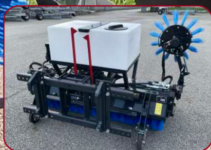
Sopvals SVF-180HB med multifäste och redskapskrokar