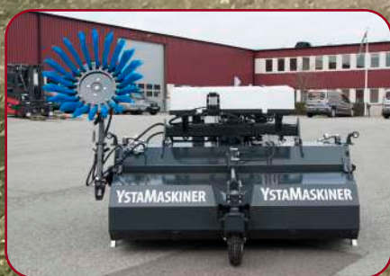
Sopvals SV-280HB Proffs HD med monterad sidoborste och vattensystem