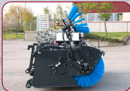
Sopskopian är kompakt i sin utformning med stor volym på skopan