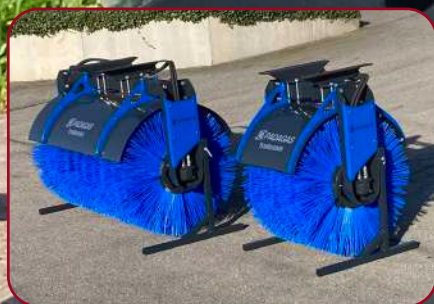
Sopvals SV-60G och SV-150G