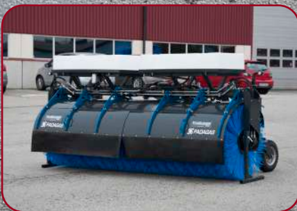
Sopvals SV-300 med 300 liter vattensystem