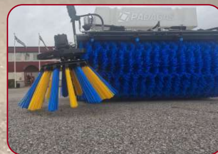
Sidoborste ökar arbetsbredden