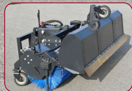
Kan även köras med uppsamlingsboxen uppfälld