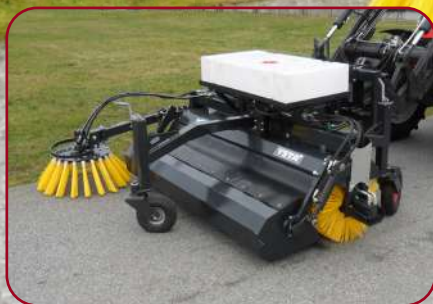
Sopvals SV-210HB med monterat vattensystem och sidoborste