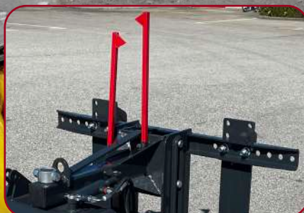
Flytläge med indikationsflaggor