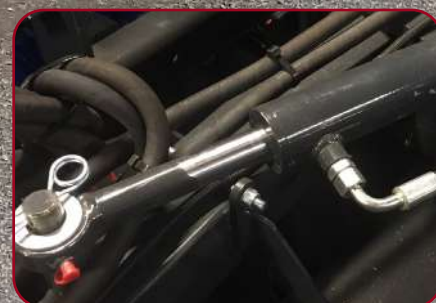
Hydraulisk justering borstvinkling (Tillval)