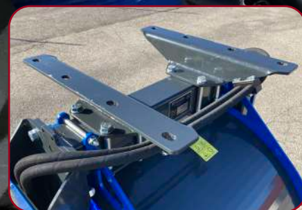
Möjlighet att bulta på valbart fäste, t.ex. grind