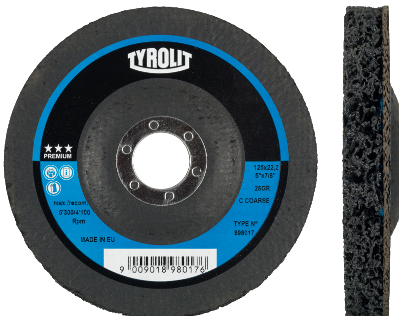
Grovrenngører til vinkelsliber