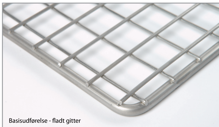
Basisudførelse - fladt gitter