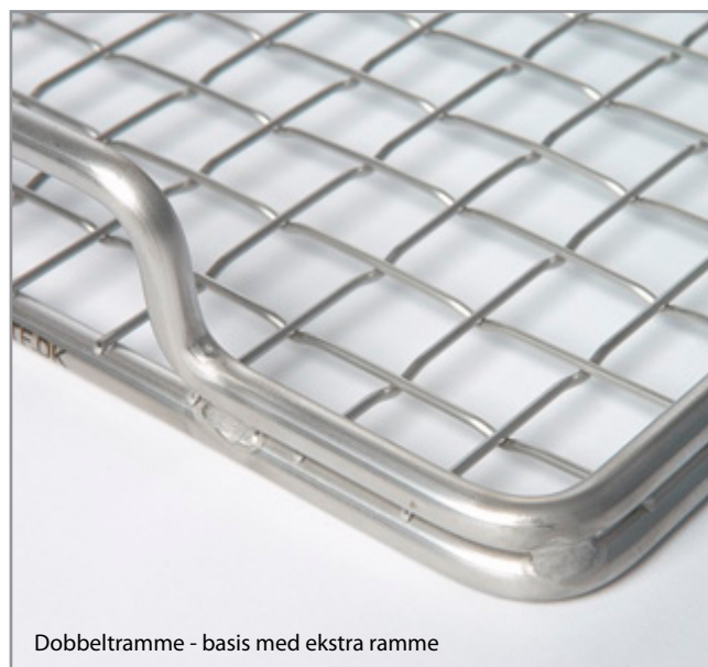
Dobbeltramme - basis med ekstra ramme