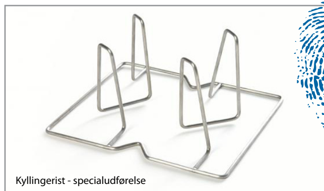
Kyllingerist - specialudførelse