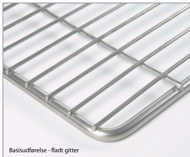
Basisudførelse - fladt gitter