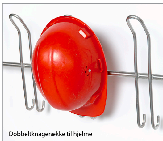
Dobbeltnagerække til hjelme