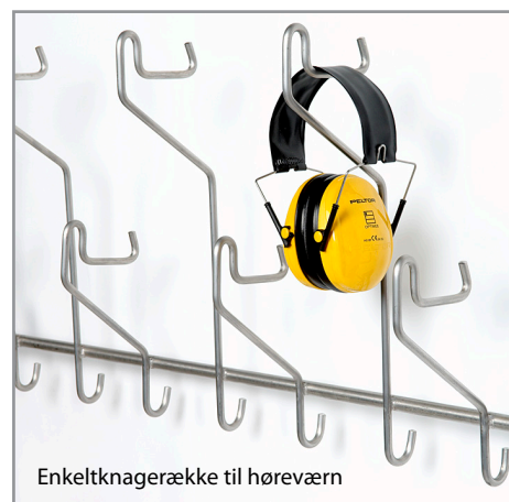
Enkeltnagerække til høreværn