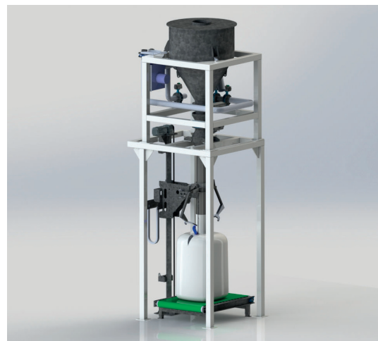
Nettosystem med veiebeholder