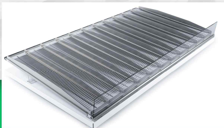
RollerTrack; fremføringssystem der giver en flot produktpræsentation. Består af rullebaner, der får produkterne til at rulle automatisk frem.