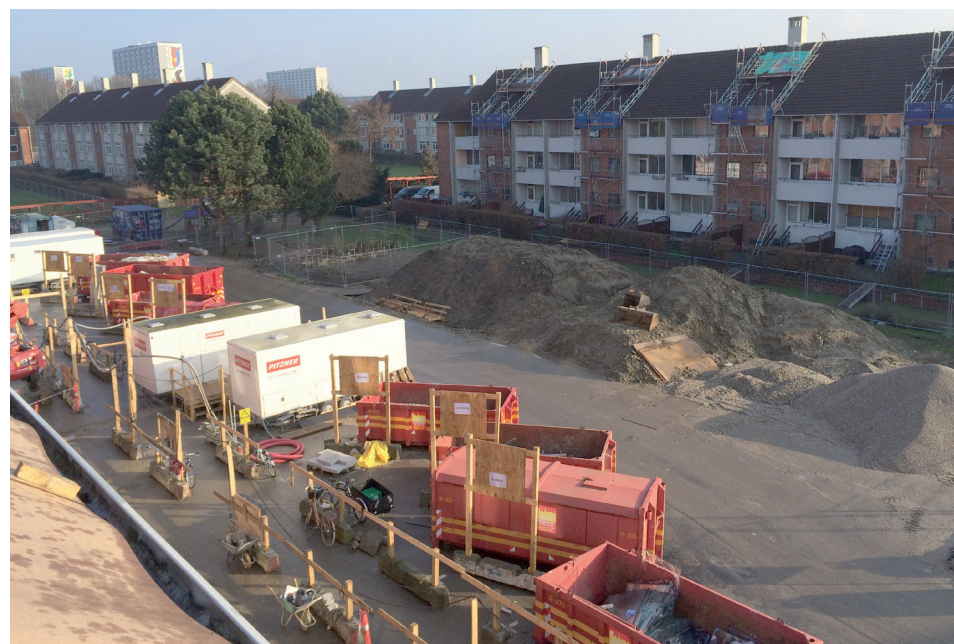
Anker Hansen & Co. A/S har lavet byggepladsen.

Anker Hansen & Co. A/S er en erfarne entreprenørvirksomhed, som varetager entrepris 01 på renoveringen af Brøndbyparken. Entreprisen dækker blandt andet over opførelsen af ny skalmur, stålkonstruktioner, altaner, nedrivning og tagforlængelse. Foruden det har Anker Hansen & Co. A/S en stor opgave i at håndtere hele byggepladsen omkring Brøndbyparken. Byggepladsen