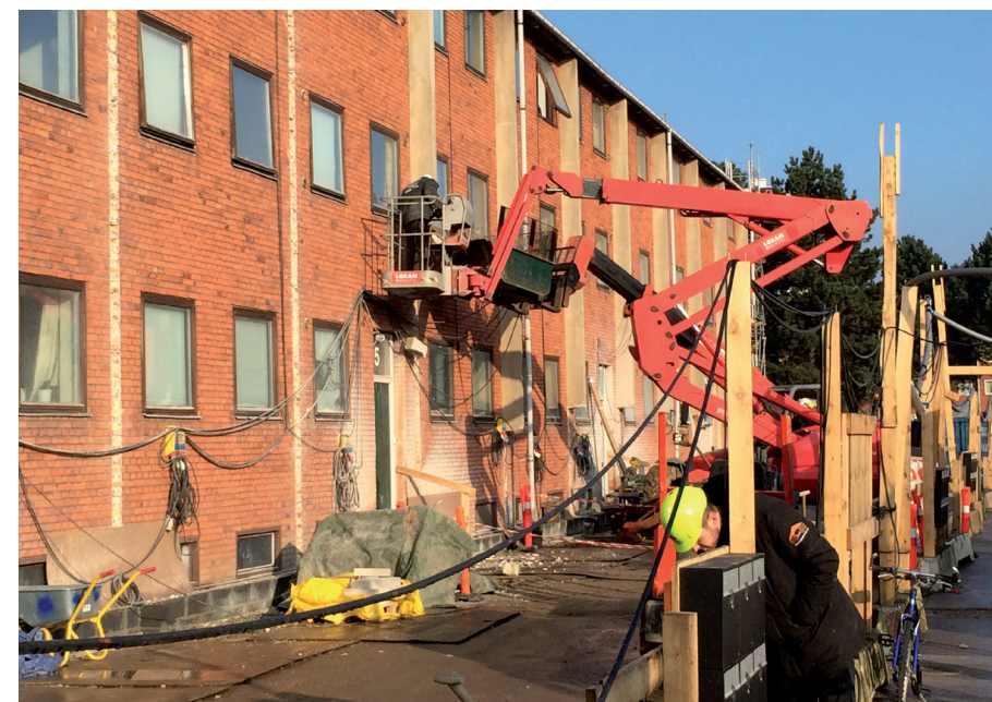
Anker Hansen & Co. A/S skal løbende stå for udlægning af jernplader, stisystem til beboere, afskærmning, strøm, toiletvogne og meget mere.

område. Vi laver generelt meget inden for Videoovervågning (ITV), adgangskontrol (ADK) og dørtelefonanlæg, og det er her nogle af vores absolutte spidskompetencer ligger, siger Flemming Tvernev. Brøndbyparken har på mange