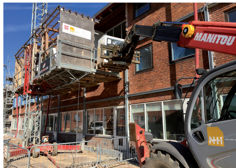
N.H.H. udskifter vinduer og døre, udfører sanering, rykker altanpartier ud, og lægger nye gulve og monterer lofter. I elleve af de 22 blokke som skal renoveres, skal N.H.H. også lave nye badeværelser.