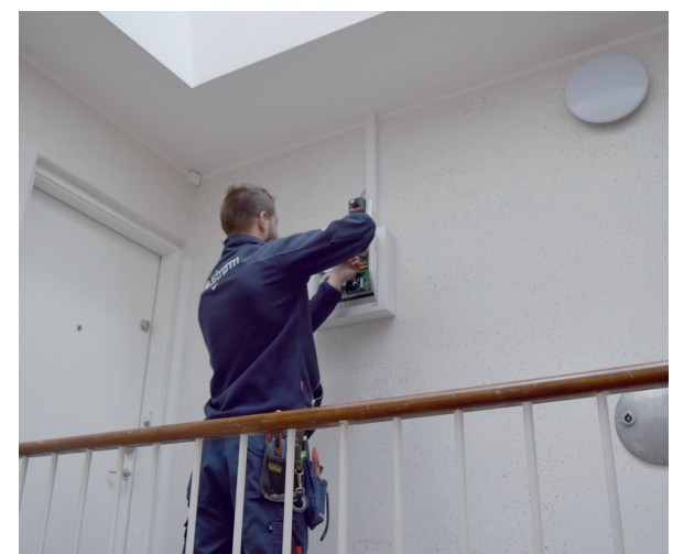
El-Strøm har stået for den indvendige el-entreprise på Brøndbyparken.