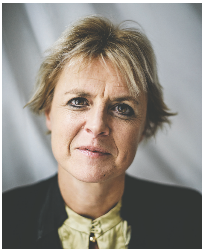
LYKKE FRIIS, TIDLIGERE KLIMA- OG ENERGIMINISTER

Med Danmarks relative lille størrelse i det globale perspektiv, har vi brug for stærke allierede, og her er det naturligt at kigge mod vores naboer og EU. EU har i det globale billede en meget stærkere gennemslagskraft – hvis vi ellers kan blive enige! Lykke Friis tager os med på en EU-rundrejse og fortæller mere omkring udfordringer og forhindringer for et fælles fodslag. Hun sætter også indsatsen ind i et historisk perspektiv og trækker tråde tilbage til Berlinmurens fald for netop 30 år siden. Derudover deler hun ud af sin imponerende viden om vores tyske broderfolk mod syd. Kom med på en tour-de-force gennem Europa og få sat Danmarks indsats ind i et større perspektiv.