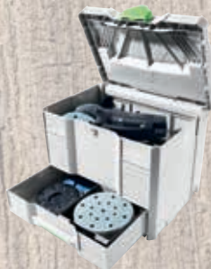
Festool systainer SYS-Combi 3