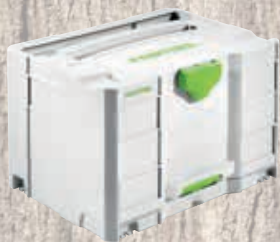
Festool systainer SYS-Combi 2