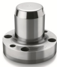
Ionbond™ 16 (tidigare T7) används för både plåtformning och skärande verktyg.

"Vi är mycket nöjda med er service och ert utbud" Citat från vår senaste kundundersökning