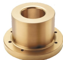
Många nya namn men samma skikt!