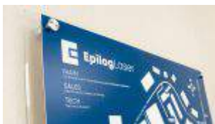
Udkæring og mærkning i graveringslaminat