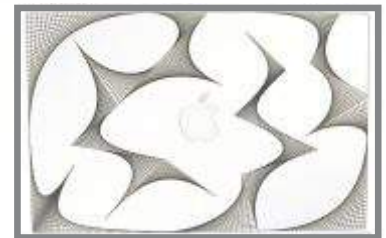
På en Macbook.