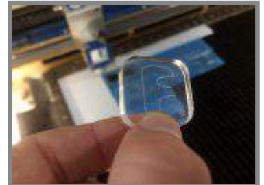
Udkæring i akryl