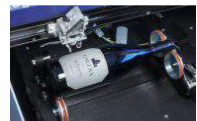
Roterende aggregat med en flaske.