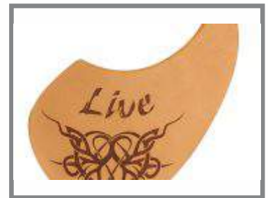
Udkæring og gravering i læder