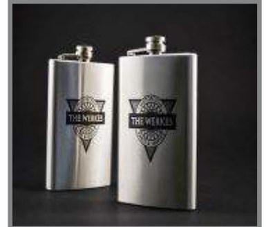
I rustfrit stål.