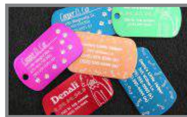
ID - Tags