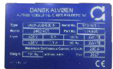
Anodiseret Alu: Blå for lyst tekst