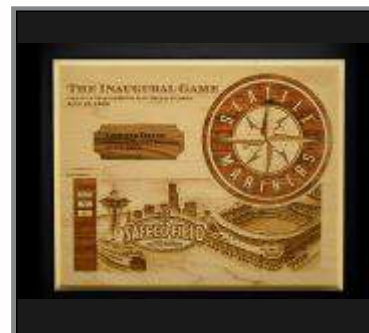
Gravering i træ.