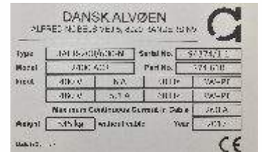
Graveringslaminat: Hvid for sort tekst