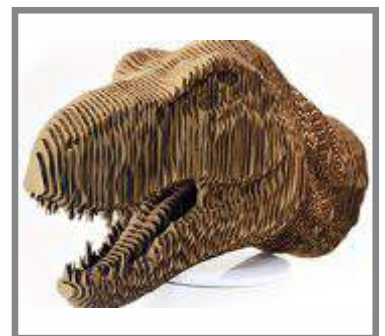
Udkæring i pap.