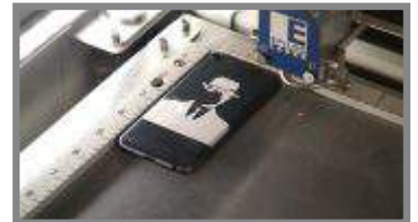
Placeret under gravering.