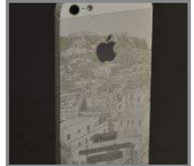
Mærkning i Iphone.