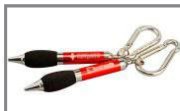
Kuglepen / Vedhæng