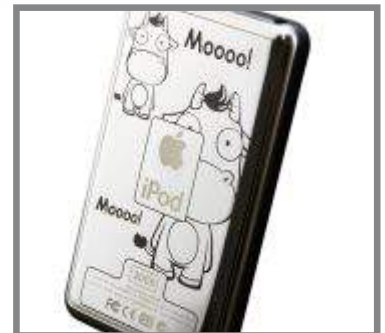
I en iPod...