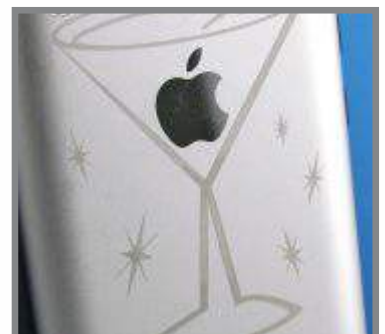
I en iPad...