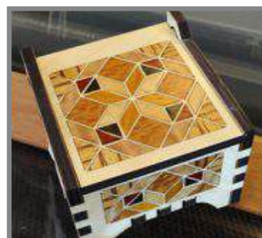
Mærkning og udskæring i træ.