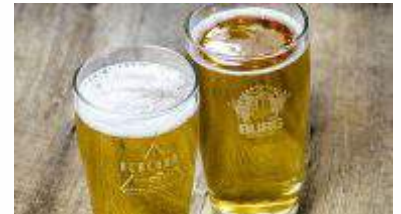
Gravering på glas.