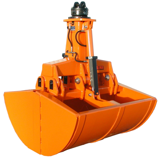
SJC2 M2 1200 L.

Grabben er forberedt for indbygning af Hydraulisk og mekanisk drejeled.