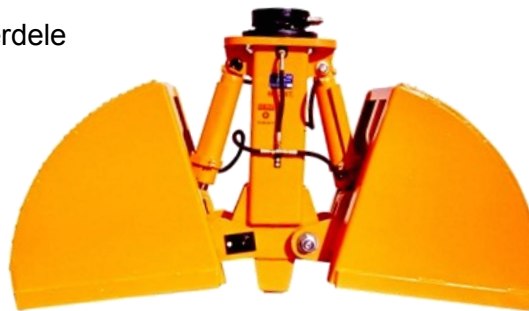
SJC2 450 L.