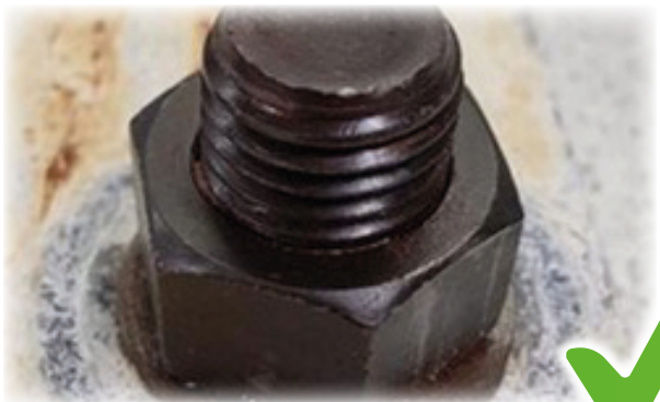
1000 timers salttågetest med City Group Bolt Caps.