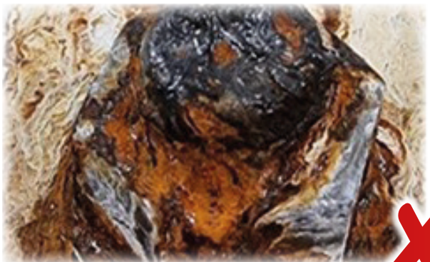
1000 timers salttågetest uden City Group Bolt Caps.

Hætterne er fremstillet af et slagfast materiale i ca. 5 mm tykkelse. Der er monteret en rustfri fjeder indvendig i bolten som fastgør hætten til bolt, eller møtrik.