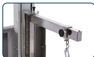
Kranarmar i rostfritt