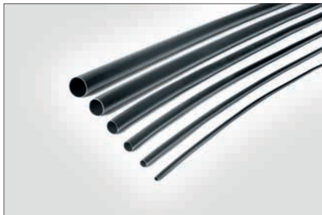
TA37 - krympeslange med indvendig lim.