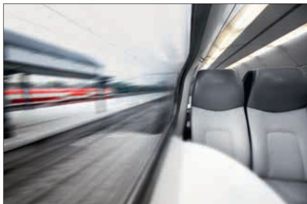
Anvendes oftest indenfor jernbaneindustrien.