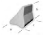
Dreizack, Schräg ACTS