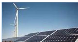
Solar / vindmøller