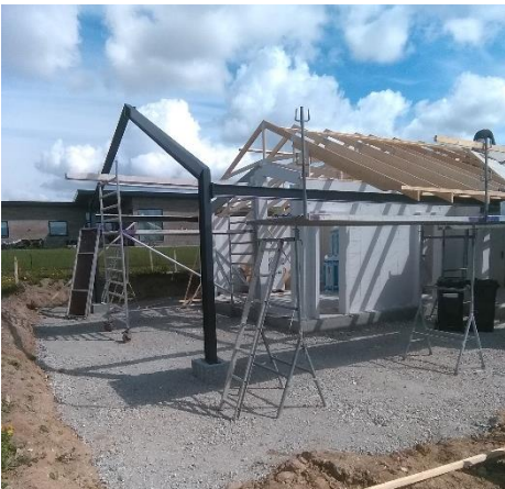
Billede 1: Stålkonstruktion og spær til byggeri, certificeret efter EN1090.