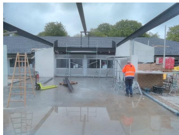
Billede 6: Bærende stålkonstruktion med IPE450-550x16.000 mm stålbjælker og div. HEB profiler. Sortmalet C1.