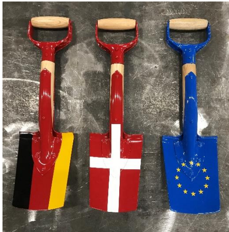
Billede 2: Specielle spader til virtuelt første spadestik til Femern Bælt-Forbindelsen.