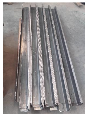
Billede 5: 288 stk. vinkelprofiler 90x90x5 mm, længde 2.000 mm til montering af loft.