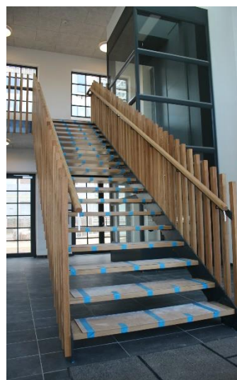
Billede 11: Ståltrappe med balkon på 1. sal samt massivt egetræs værn og trin. Leveret og monteret i Søborg.