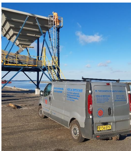
Billede 10: Drift og vedligehold på produktionsanlæg. Smedeservice og industriservice hvor du har brug for det.