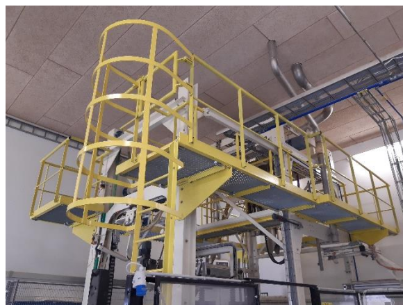
Billede 7: Gangbro ca. 18 meter med adgangsstige til drift og service af industrialnæg. Varmgalvaniseret og malet i signal gul. Vi har designet, fremstillet, overfladebehandlet og monteret.

Se mere smedearbejde på https://hnielssons.dk/smedearbejde/