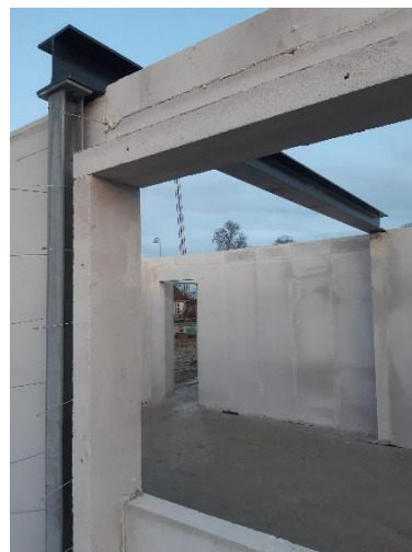
Billede 8: Galv. søjler og stålbjælker korrosionskategori C3 monteret i Køge.