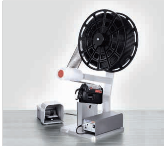
Bench Mount Kit CPK med fodpedal, Autotool 2000 CPK, Power Pack CPK samt T18RA3500.