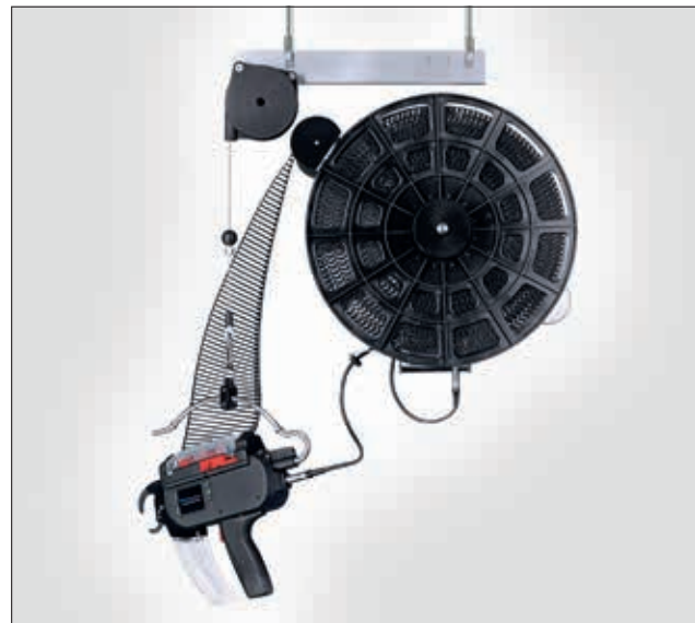
AT2000 CPK opstilling med ophæng, Power Pack CPK samt T18RA3500.

Der tages forbehold for tekniske ændringer.