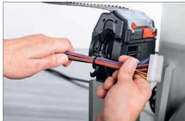
Applikation med montagebænk CPK.