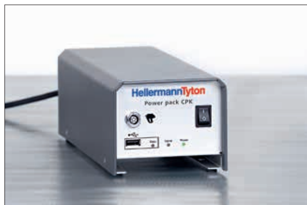
Power Pack til autotool AT2000 CPK.