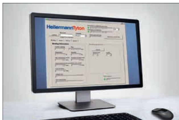
Autotool 2000 CPK Service software.