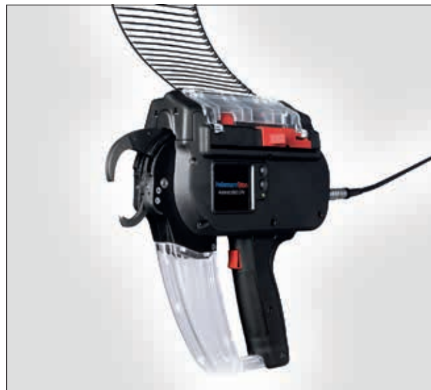
Autotool 2000 CPK.