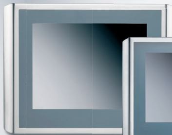
Panel-PC CP77xx i rostfritt stål