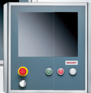
Kontrollpanel CP79xx i rostfritt stål