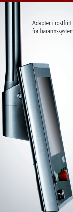
Adapter i rostfritt stål för bärarmssystem