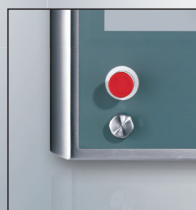
Kundspecifik design med specialknappar