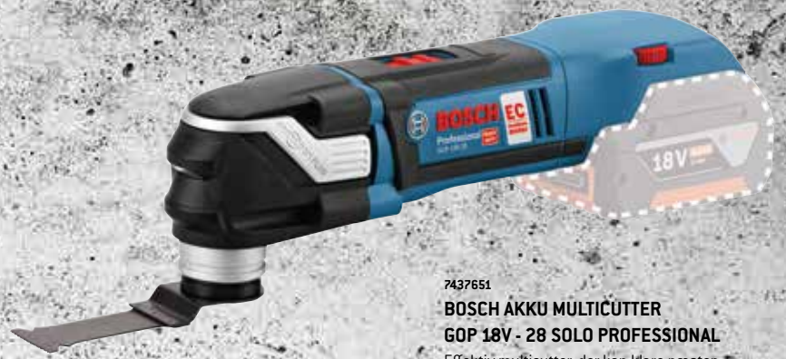
7437651 BOSCH AKKU MULTICUTTER GOP 18V - 28 SOLO PROFESSIONAL Effektiv multicutter, der kan klare næsten alle snit. Høj arbejdshastighed, takket være den højtydende EC motor. Ergonomisk udformning. Leveres ekskl. kuffert, lader og batteri