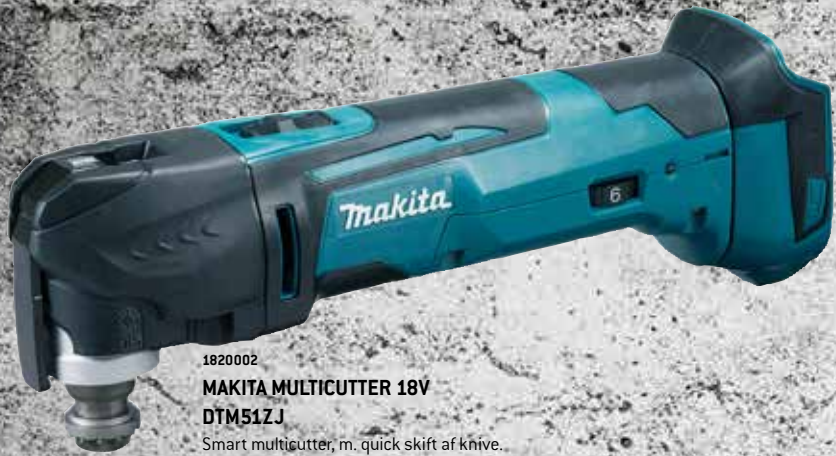
1820002 MAKITA MULTICUTTER 18V DTM51ZJ Smart multicutter, m. quick skift af knive. Ideel maskine til skære- og slibearbejder i alle materialer. Anti restart funktion og overbelastningssikring. Vægt 2,2 kg. Leveres i MAKPAC systemkuffert ekskl. batteri og lader