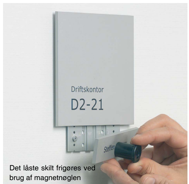
Det låste skilt frigøres ved brug af magnetnøglen