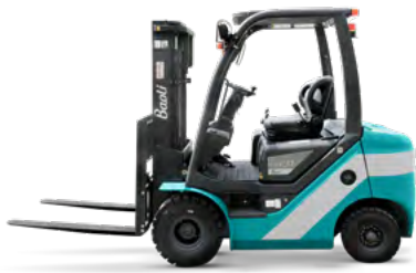
KBD 15-20+ / KBG 15-20+

🏠 1.5 - 1.8 - 2.0 t @ 500 mm 📏 6000 mm ⚙️ (Diesel) HDI (EU5) ⚙️ (LPG) Deutz (EU5)