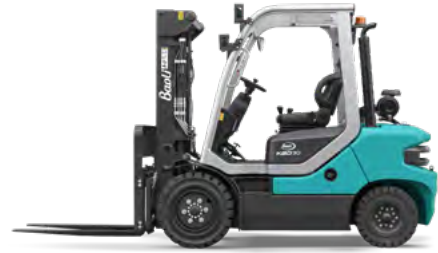
KBD 25-35 / KBG 25-35

🏠 1.5 - 1.8 - 2.0 t @ 500 mm 📏 6000 mm ⚙️ (Diesel) HDI (EU5) ⚙️ (LPG) Deutz (EU5)