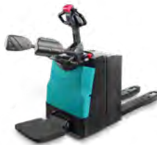
EP 20-111 / EP 20-111Li