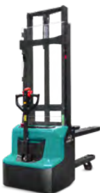
KBS 12 / KBSI 12

🏠 1.2 t @ 600 mm 📏 3600 mm 🔋 24 V, 60 Ah Li-ion