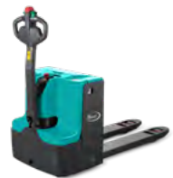
EP 16-N01 / EP 20-N04

🏠 1.6 - 2.0 t @ 600 mm 🔋 24 V, 160 - 210 Ah