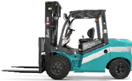
KBD 40-50S / KBG 40-50S