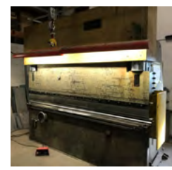
Darley kantpresse Type AP 150 T x 3000 mm Årg. 1975, åbning 300 mm