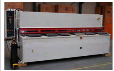
Baykal hydr. maskinsaks Type HGL 3106, årg. 2016 3060 x 6 mm, Cybtouch 6