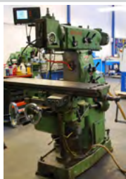
Pedersen universal fræser Type PU-2, 1400 o/min. ISO 40, Heidenhain digital