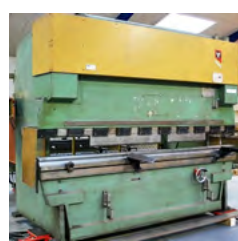
Fasti Hoan kantpresse CPHE 80/30, 3000 mm x 80 T Årg. 1979, manuel bagstop