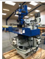
Fræser type TM 300 Årg. 2012, DEMO, mot. tilspænding, DRO, ISO 40