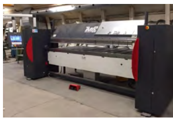
HMT kantbukkemaskine Type Maxi 30/40 SH, DEMO Årg. 2016, kap. 3020 x 4 mm