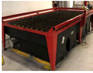
Samson plasmaskærer Type 510, 1500 x 3000 mm 105A Hypertherm strømkilde