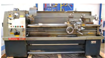
Maxturn drejebænk Type PHL-1860, årg. 1990 centrerpatron, endestop