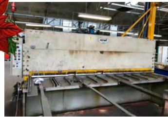
Nymi maskinsaks 3100 x 6 mm, digital bagstop oplæggerarme