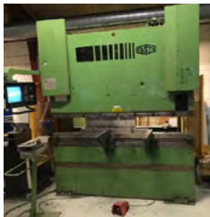
Fasti kantpresse Kapacitet 2000 mm x 50 T, Delem styring, X på bagstop