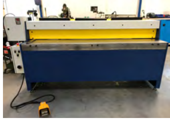
Kapema maskinsaks Type SMP 20/20, DEMO pneum. pladefang, motoranslag