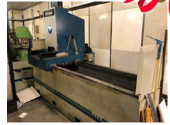
Göckel planslibemaskine Type U 65 EL, aut. tilspænding inkl. magnetplan 1400x300