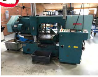
Bigstone dobbeltsøjle sav Type CF-420AW, 420 mm Ø spåntransportør, meget velholdt