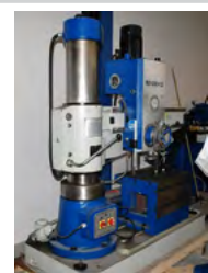
Radialboremaskine Type RD 32/10, årg. 2012 DEMO 32 mm, MK4, aut. tilspænding