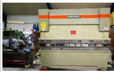
Donewell kantpresse Type 125 - 3000 H, årg. 1987 3000 mm x 125 T, X på bagstop