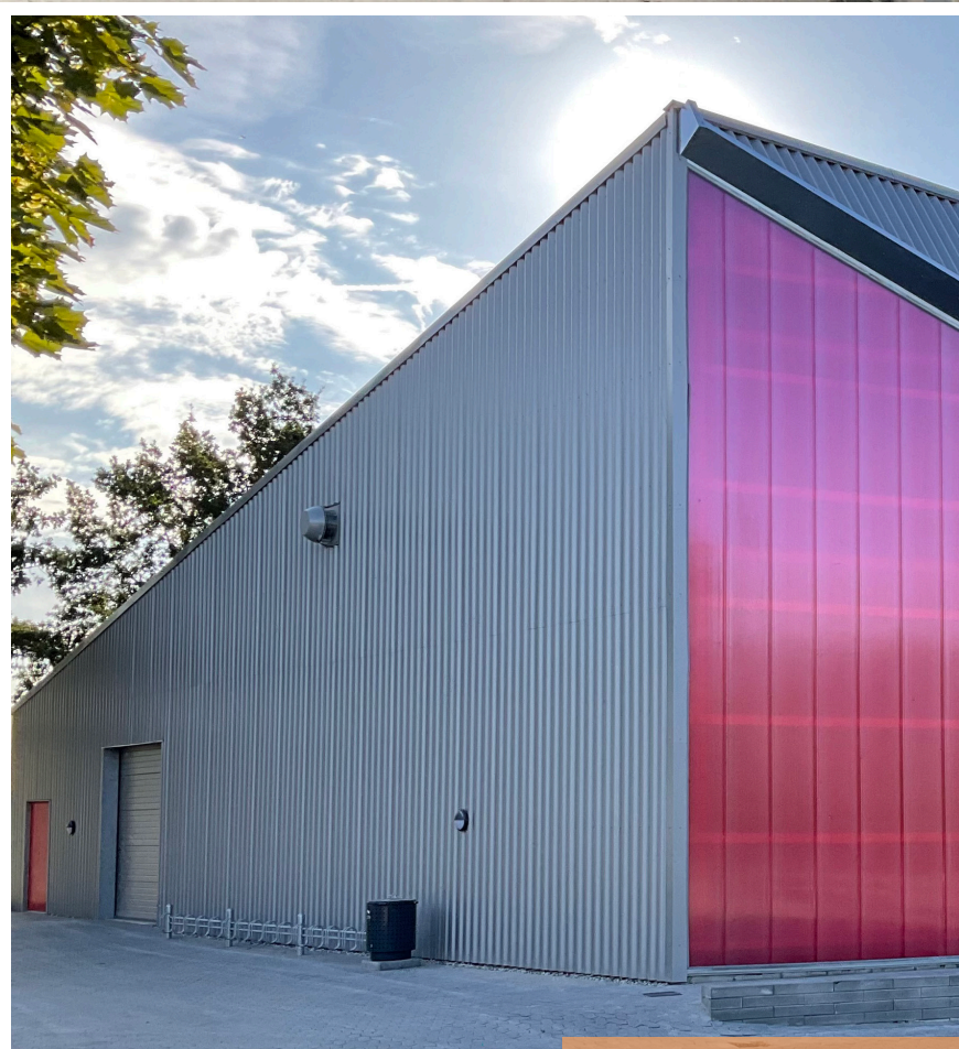
Skaterhockeyhal i Rødovre