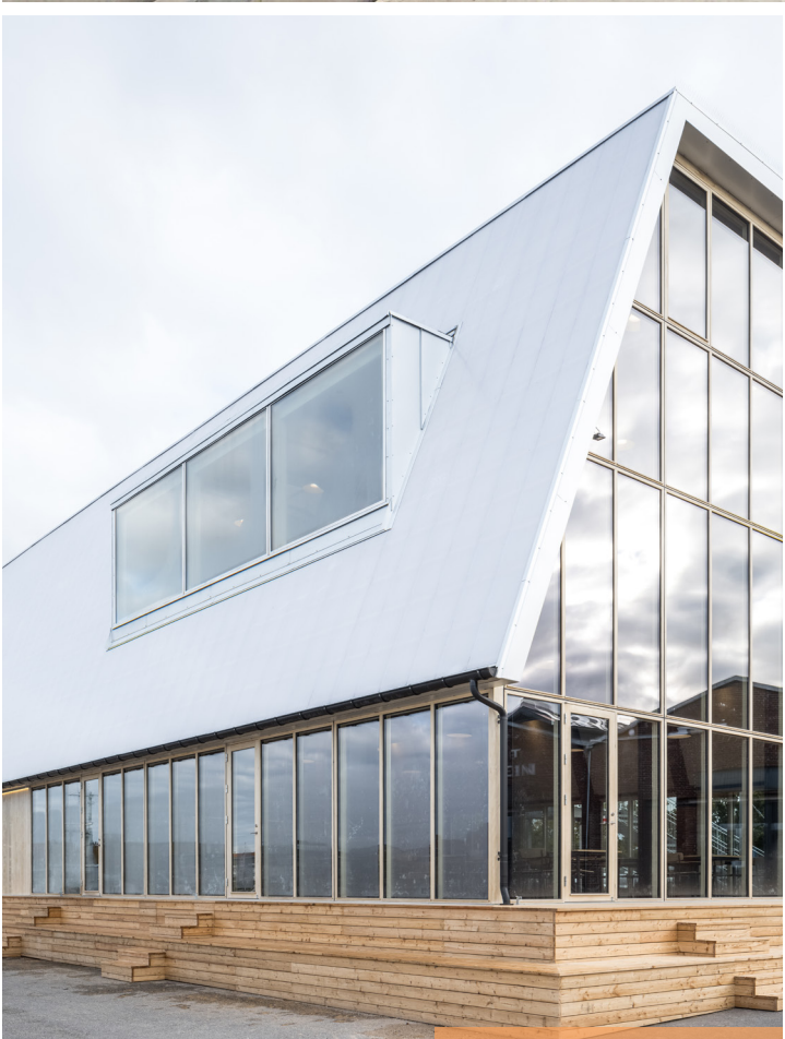
Pakhuset Braunstein i Køge