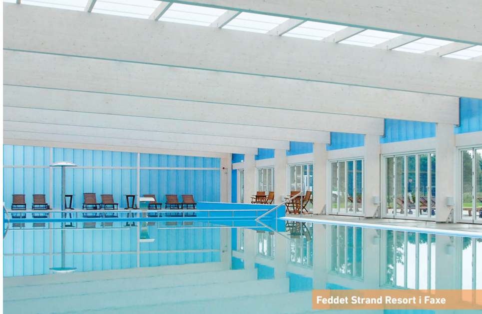
Feddet Strand Resort i Faxe