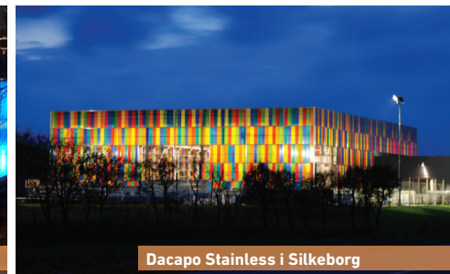
Dacapo Stainless i Silkeborg