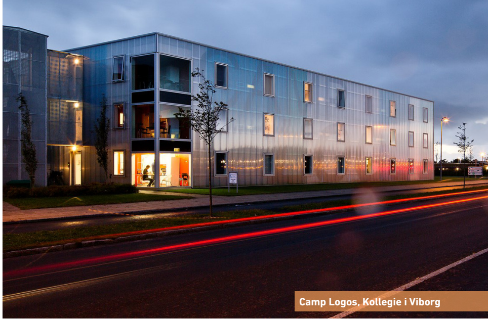
Camp Logos, Kollegie i Viborg