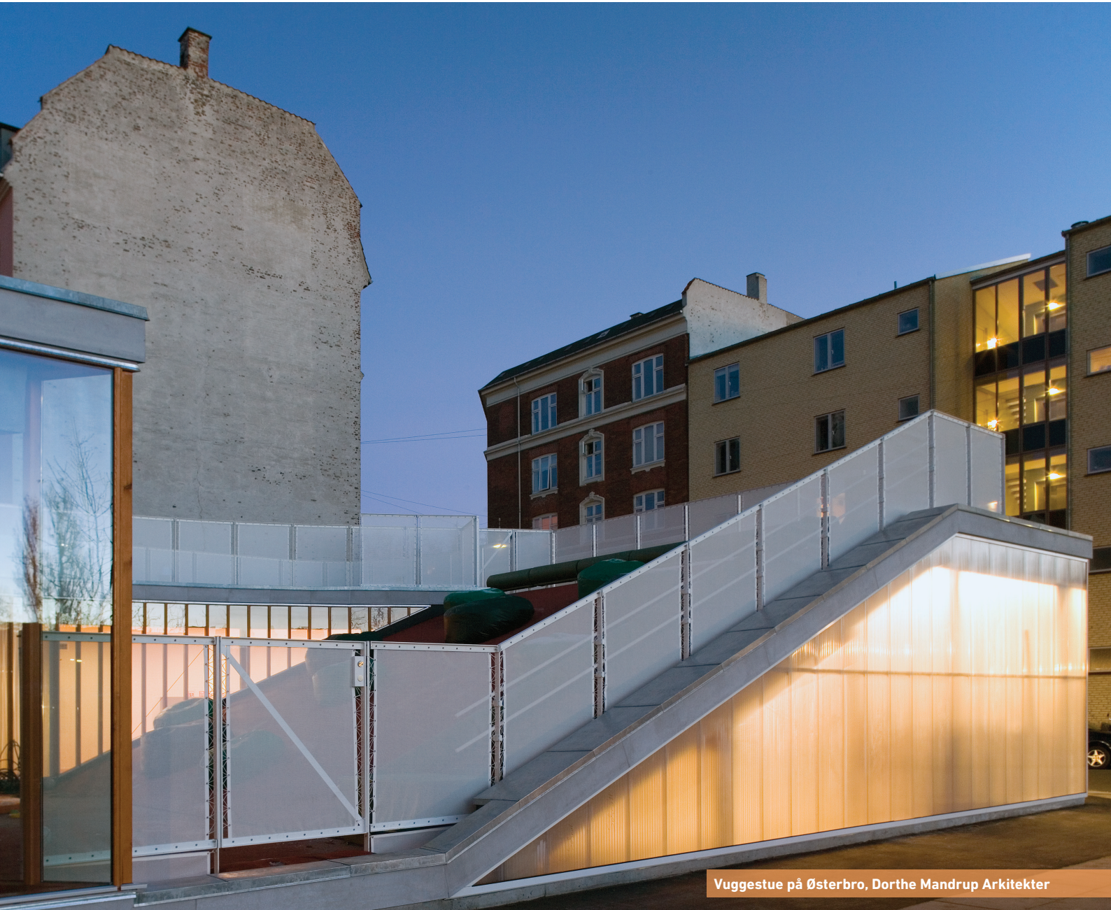
Vuggestue på Østerbro, Dorthe Mandrup Arkitekter