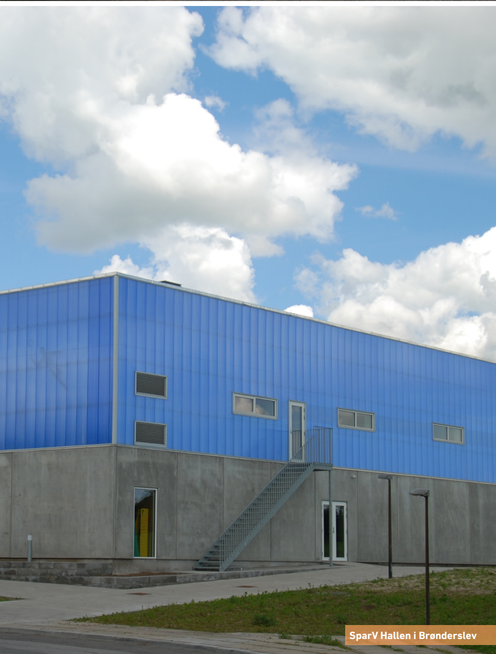
SparV Hallen i Brønderslev