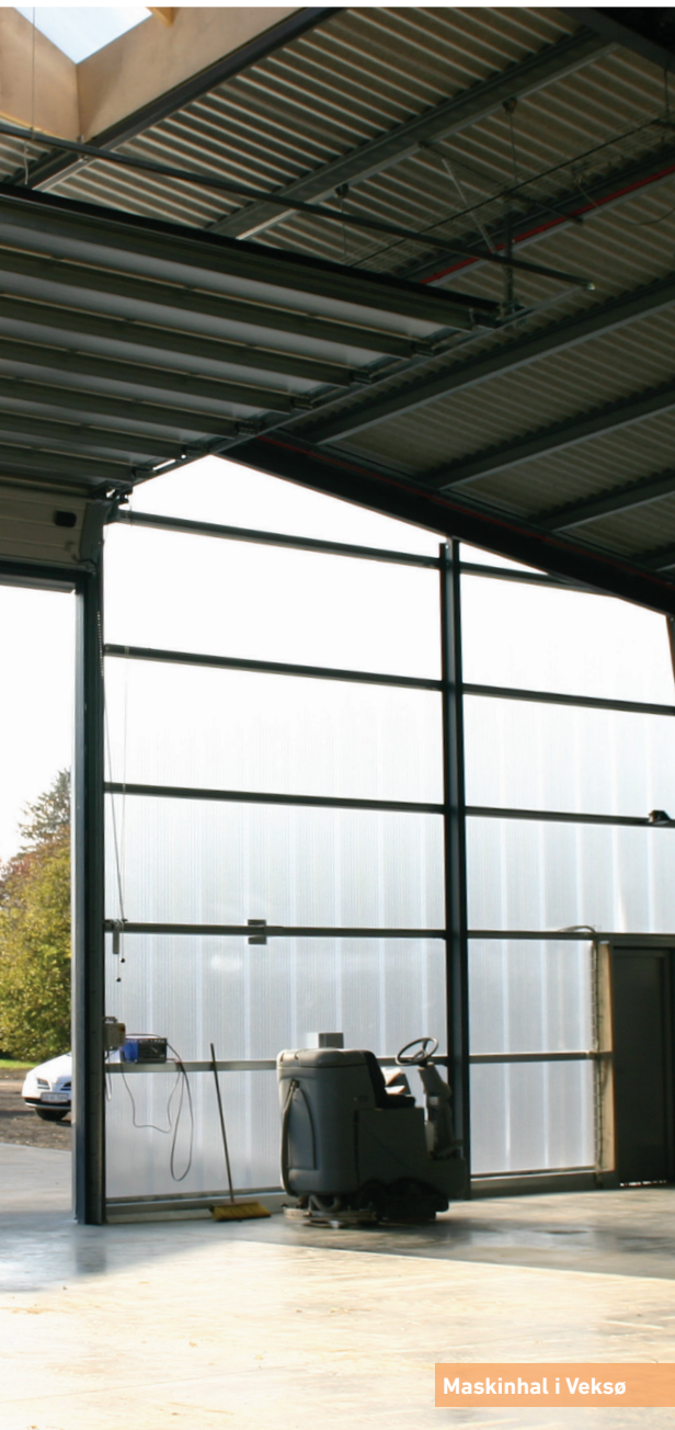
Maskinhal i Veksø