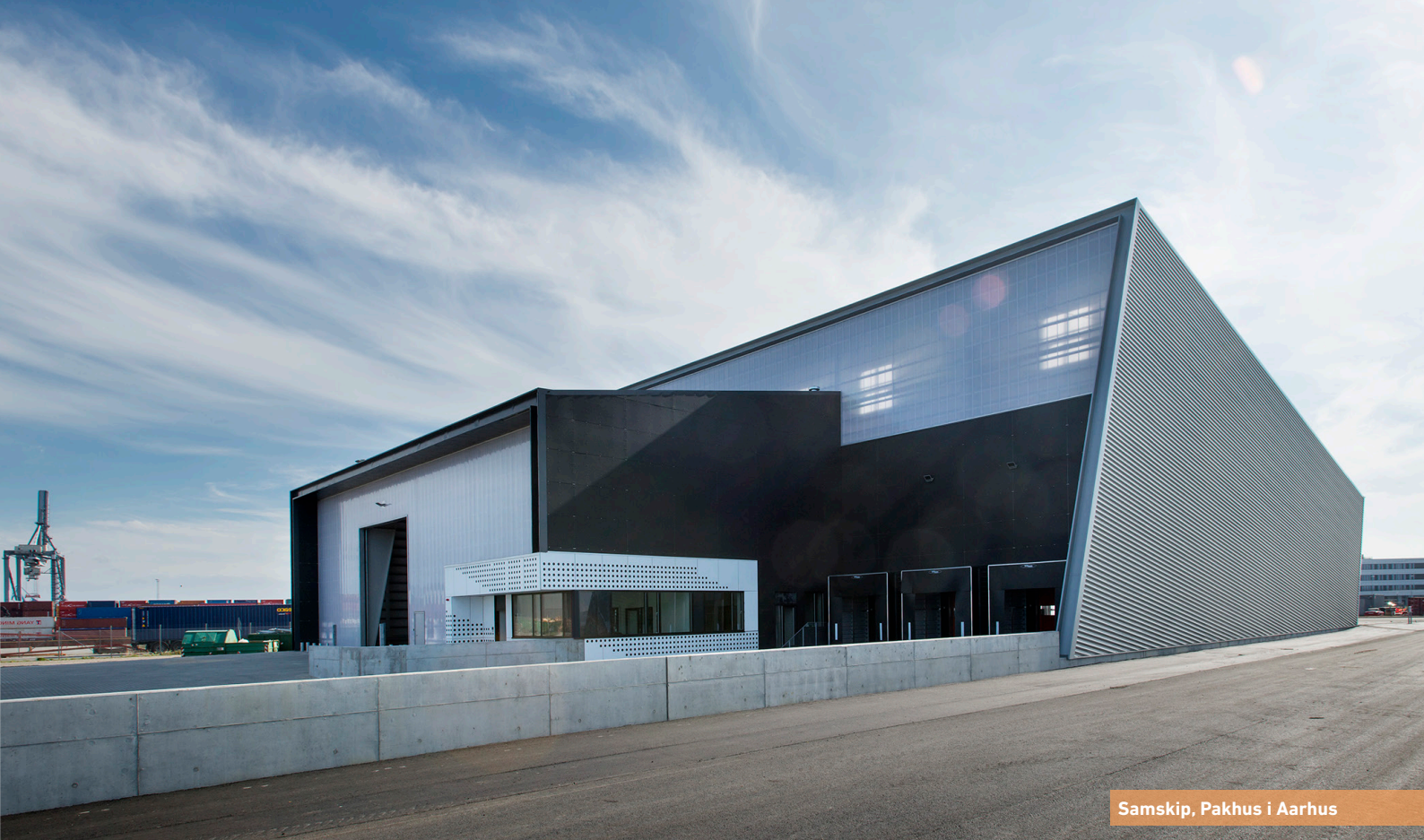
Samskip, Pakhus i Aarhus