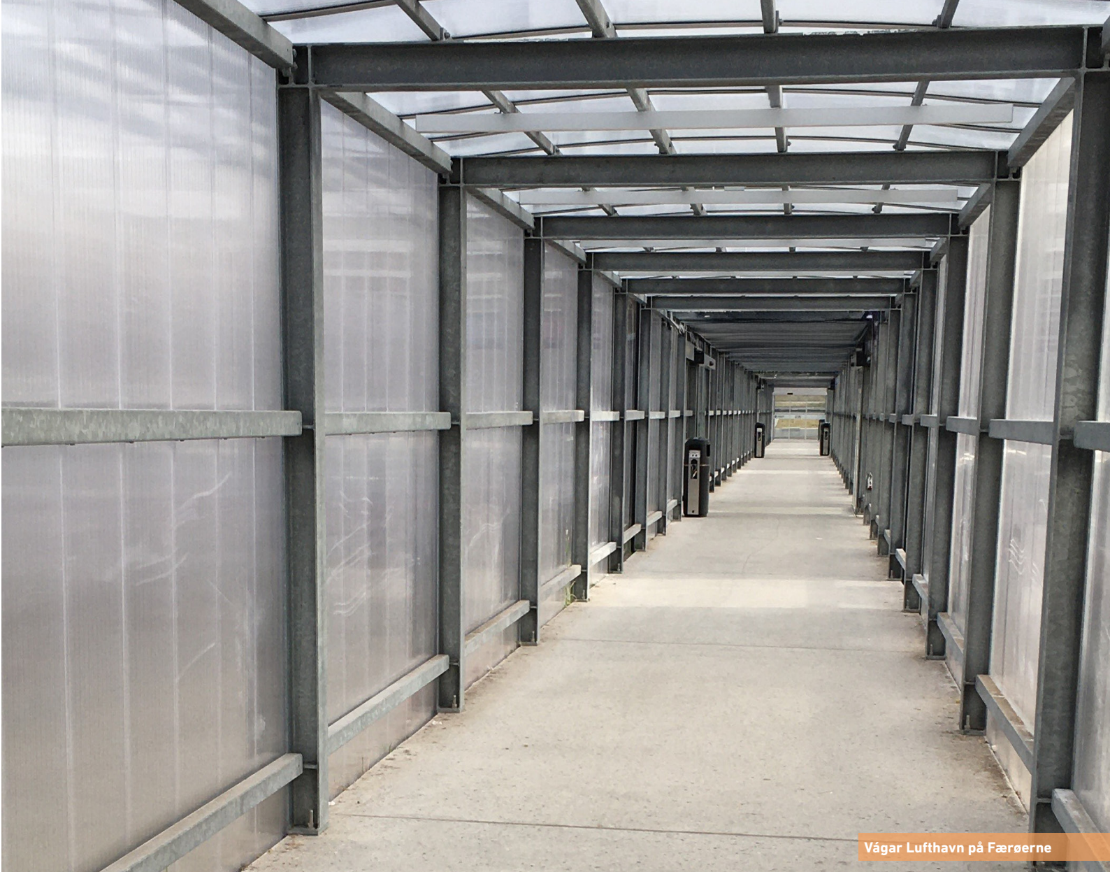
Vágar Lufthavn på Færøerne