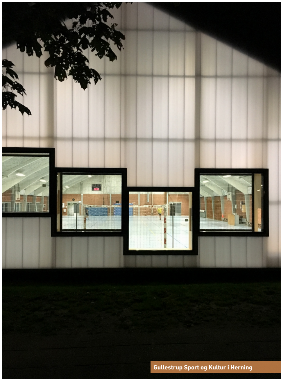
Gullestrup Sport og Kultur i Herning