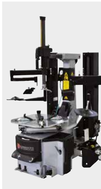
Dæskifter, WTM 512