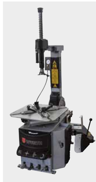
Dæskifter, WTM 301