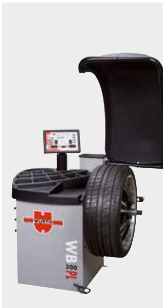
Afbalancering, WB 301 PL

Størstedelen af vores sortiment er på lager, men det er først til mølle princippet som er gældende, så tøv ikke for længe.