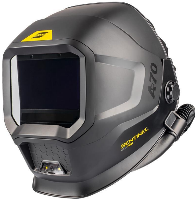
Sentinel A70 Air Pro