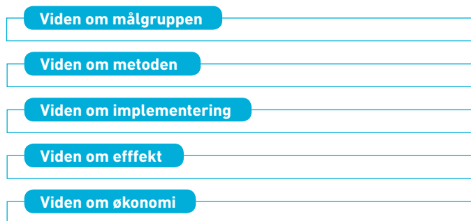
Figur 1. Vidensdeklarationens dimensioner:

Grundantagelsen bag Vidensdeklarationen er, at de fem vidensdimensioner alle er nødvendige for at skabe et samlet billede af aktuelt bedste viden om en given indsats/metode med henblik på anvendelse og implementering af metoden. På sigt bør enhver indsats eller metode være vidensbaseret, det vil sige, at der er viden om hver af de fem vidensstyper.