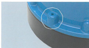
Luftventilen sikrer, at pumpen starter pålideligt

Tilbehør: Slangekobling 1 1/4" (Mat. Nr. JP00327) Simer Level Control (Mat. Nr. JP46884)