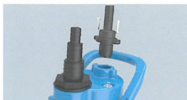
Udskifteligt kabel til problemfri udskiftning af kabel