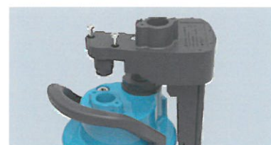
Tilbehør: Simer Level Control – let at sætte ind i pumpen