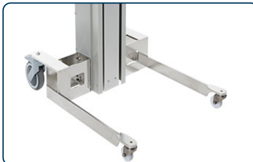
Box ben med fasta framhjul