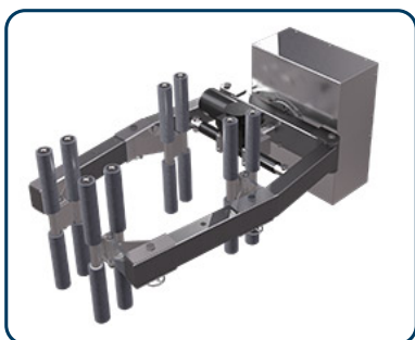
Drivet klämverktyg för vridning av fat/rollar