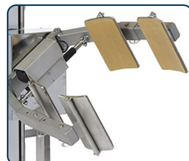
Drivet klämverktyg för vridning av fat/rollar