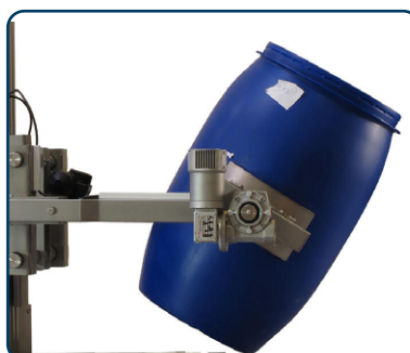
Drivet klämverktyg för tilt av fat/rollar