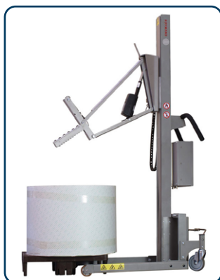
Impact 200 med rullexpander