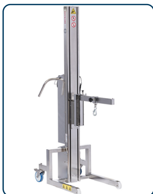
Inox 200 med kranarm

Inox 200 erbjuder en mängd olika verktyg, ben och hjul som finns i ett antal olika konfigurationer, beroende på uppgiften. INOX 200 är utvecklad tillsammans med de branscher som har stränga krav på renhet och hygien (IP66). Som exempel kan nämnas är läkemedels- och livsmedelsindustrin.