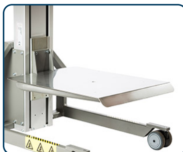
Lastbord i rostfritt eller aluminium