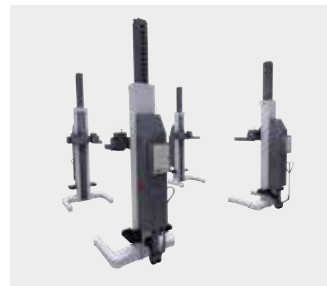
Løftesøjler, 8,2 t