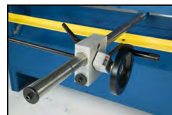
pladeanslag m. mm-tæller