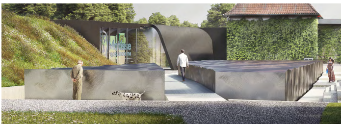
Mock-up av ståltaket plassert på tomta