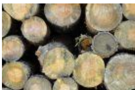
Rester fra træstammer