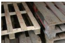
eu paller og engangspaller