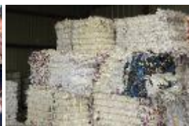
pvc og folie