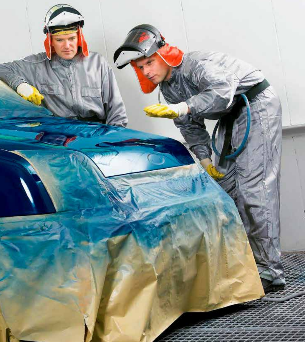
Samlet voksede Top 100-segmentets bundlinje med 219 mio. kr. – svarede til en stigning på knap 7 procent, det skal ses i forhold til en stigning på 37,8 procent i 2015.