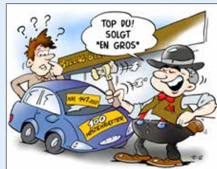
Illustration: Poul Carlsen

af de indsatte aktiver. Et overskud på 2 mio. kr. kan karakteriseres som et stort overskud i én virksomhed, mens et overskud på 10 mio. kr. i en anden virksomhed kan karakteriseres som et lille overskud. Afkastningsgraden bedømmer overskuddets størrelse ud fra de ressourcer, der er indsat for at opnå det pågældende resultat. Afkastningsgraden findes ved at dividere resultat før skat med den gennemsnitlige balance-