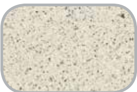
Laminatbordplader Bl.a. "Coran"