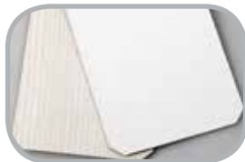
Langelementer Diverse dekorer