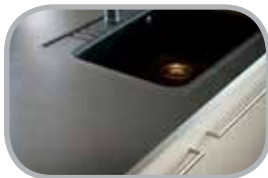
Laminater Højtryks og basis