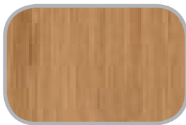
Carboniseret Vertikal og horisontal