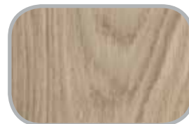
Trappetrin Massive trappetrin i flere europæiske træsorter