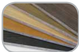
Melaminplader Melaminbelagt spån og synkroniseret