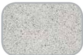
Laminatbordplader Bl.a. "Lava Dust"