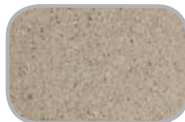
Spånplader Almindelig og spånplade til gulv og klimagulv