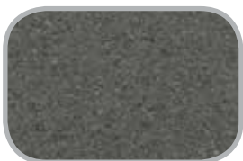
Laminatbordplader Bl.a. "Quarstone"