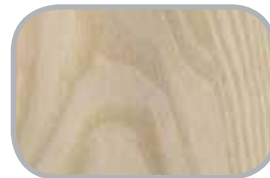
Lister Lister til mange formål i både fyrtræ og hårdtræ