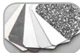
Vinduesbundstykker Duropal og basis