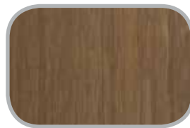
Ekstrem Natur og carboniseret