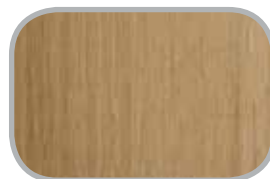
Bambusbordplader Se ovenfor