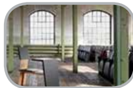
Linoleum til møbler