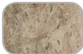
OSB Med/uden fer og not