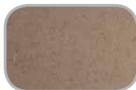
Træfiberplader Bløde, hårde og lack board hvid