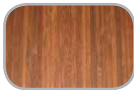
Super Carboniseret Vertikal og horisontal