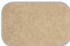
MDF Basis, brandhæmmende, bøjelig, fugtbestandig m.m.