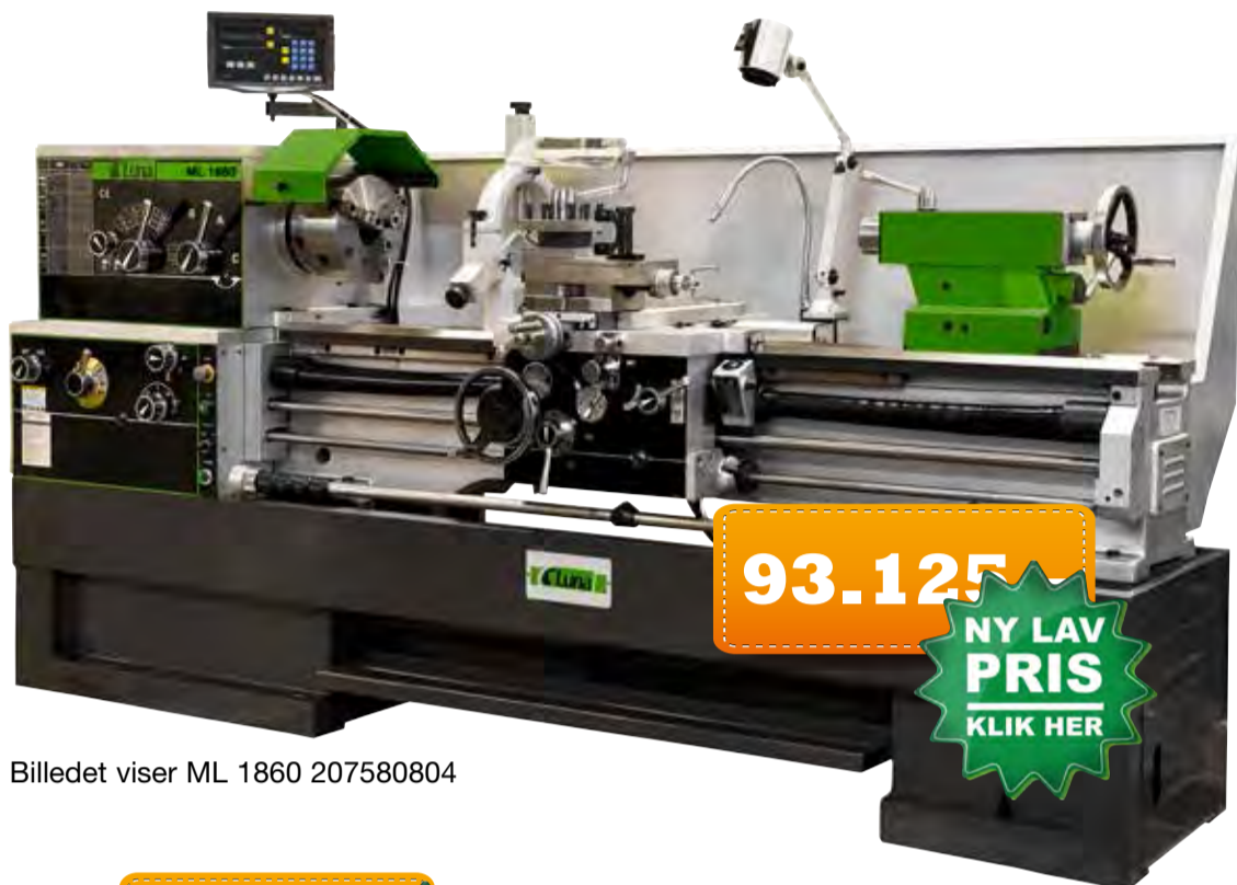
Billedet viser ML 1860 207580804